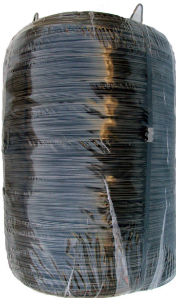
(A) Compactos de 900 Kg