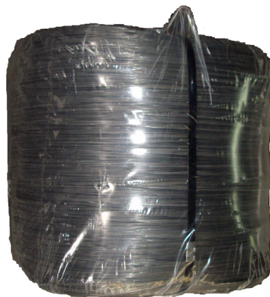
(B) Compactos de 500 Kg