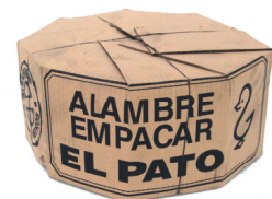
Bobinas embaladas con cartón