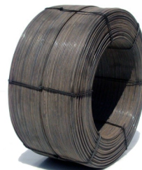
Bobina de 45 Kg